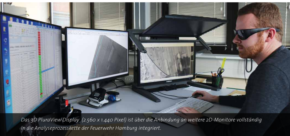
Das 3D PluraView Display (2.560 x 1.440 Pixel) ist über die Anbindung an weitere 2D-Monitore vollständig in die Analyseprozesskette der Feuerwehr Hamburg integriert.

1945 wurden 213 Luftangriffe auf Hamburg geflogen und insgesamt etwa 107.000 Spreng-, 3 Millionen Stabbrand- und 300.000 Phosphorbrandbomben abgeworfen – mit erheblichen „Kollateralschäden“, denn rund 70 Prozent der Bebauung der Metropole wurden zerstört. Da kam alles vom Himmel herunter, was die Kriegskunst seiner Zeit so hergab. Die größten, bunkerbrechenden Bomben hatten ein Gewicht von 12.000 lbs (englische Pfund), die kleinsten Stabbrandbomben lagen bei 4 lbs. Und es wurde dokumentiert. Es gibt