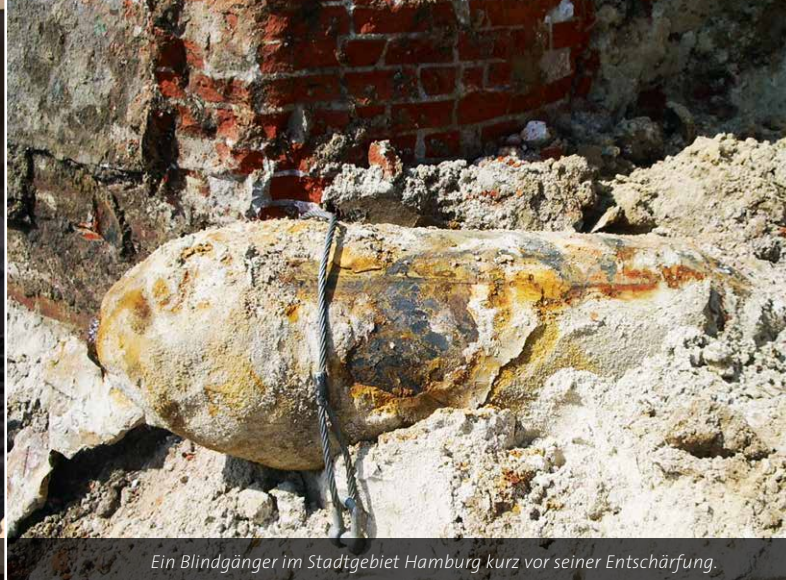
Ein Blindgänger im Stadtgebiet Hamburg kurz vor seiner Entschärfung.